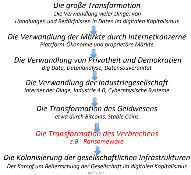
Abb.1 Die Transformation der Erpressung und des Verbrechens