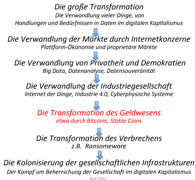
Abb. 1 Die Transformation des Geldwesens im Digitalisierungspfad

Wir geben gerne den Hinweis, dass dieser Essay sehr kurzgehalten ist, da ein ausgezeichnetes Video des Informatik-Studierenden M. Bazzato aus dem Jahr 2016 vorliegt, das den Kern von Blockchains und Bitcoins zeitlos vermittelt (Bazzato 2016).