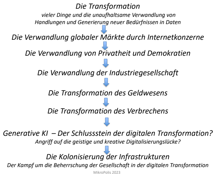
Abb.1 Die Transformation der Erpressung und des Verbrechens